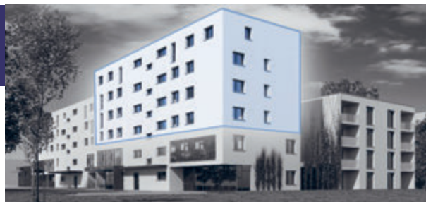
Ansicht West – Lage der Wohnungen C1 – C11